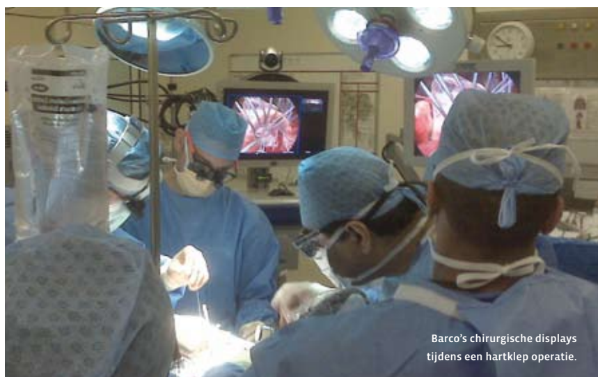
Barco's chirurgische displays tijdens een hartklep operatie.

In de moderne gezondheidszorg zijn kwaliteitsvolle klinische beelden niet alleen noodzakelijk in de radiologie-afdeling, maar in de volledige zorginstelling. Daarom heeft Barco een reeks klinische review displays die voldoen aan alle medische standaarden en de DICOM standaard voor een betrouwbare weergave van medische beelden.