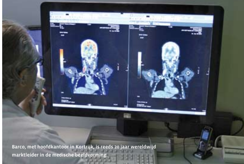
Barco, met hoofdkantoor in Kortrijk, is reeds 20 jaar wereldwijd marktleider in de medische beeldvorming.

Econocom heeft een nieuw competentiecentrum opgericht, Medical Business Unit, om IT producten en oplossingen aan te bieden die tegemoet komen aan de specifieke behoeften van de medische sector. In deze hoedanigheid heeft Econocom Barco aangeduid als voorkeurspartner voor het leveren van medische displays. De wereldleider op het gebied van medische beeldvorming heeft door de jaren heen een ijzersterke reputatie opgebouwd op het gebied van innovatie, kwaliteit en service. De uitzonderlijke beeldkwaliteit van de Barco schermen helpt medici levensbepalende beslissingen te nemen om hun patiënten de zorg te geven die zij verdienen.